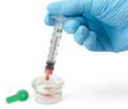
2. 재질 한 혈액을 지정된 선까지 주입한다.