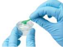
1. Greena Cap을 제거 한다.