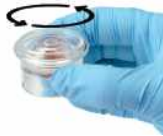
3. 용기를 수평으로 놓은 상태에서 5회 정도 둥글게 돌린다.