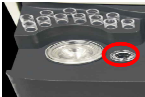
3. 그림과 같이 용기를 기기에 장착시킨다.