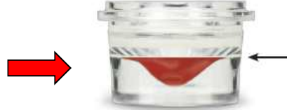
까만 확산표 표시선 아래까지 재워 넣는다. (0.7cc)