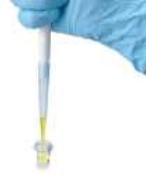
2. 파이펫터를 이용하여 300 \mu L를 샘플 법에 옮겨 담는다.