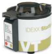
1. 재질한 용기를 원심분리한다.

혈장 또는 혈청 검체 : 재질 용기는 Lithium heparin 또는 SST 용기사용(EDTA 사용금지)