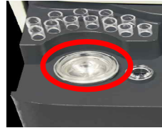
4. 그림과 같이 용기를 기기에 장착시킨다.

※WBS(Whole Blood Separate)를 한번 더 꼭 눌러 장착 시켜주세요.