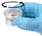
3. 용기를 수평으로 놓은 상태에서 5회 정도 동글게 돌린다.