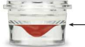
마만 확산표 표시선 아래까지 채워 넣는다. (0.7cc)