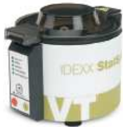
1. 채혈한 용기를 원심분리한다.

혈장 또는 혈청 검체 : 채혈 용기는 Lithium heparin 또는 SST 용기사용(EDTA 사용금지)