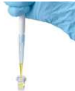
2. 파이펫터를 이용하여 300 \mu L를 샘플 원에 옮겨 담는다.