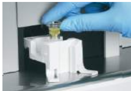
3. 그림과 같이 용기를 기기에 장착시킨다.