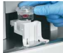
4. 그림과 같이 용기를 기기에 장착시킨다.

혈장 또는 혈청 검체 : 채혈 용기는 Lithium heparin 또는 SST 용기사용(EDTA 사용금지)